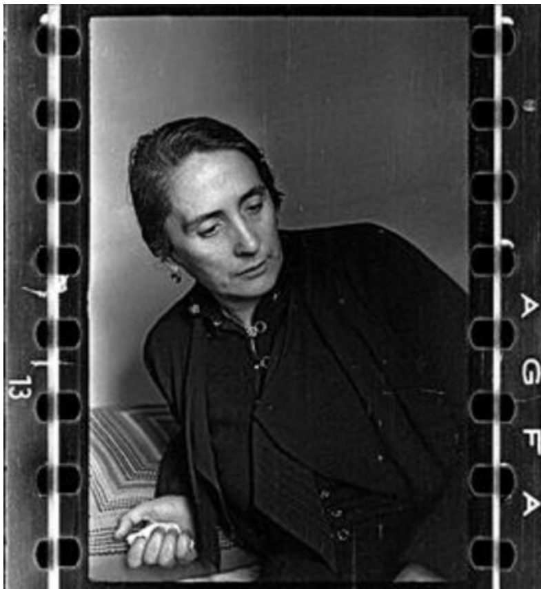
Dolores Ibárruri, la Pasionaria, retratada en Madrid por David Seymour, 'Chim', en abril de 1936, antes de empezar la guerra, o a finales de julio de 1936.