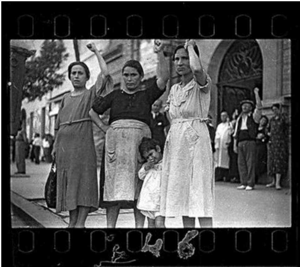
Tres mujeres saludan al paso del féretro del general Luckács, de las Brigadas Internacionales. Gerda Taro, Valencia, junio de 1936. GERDA TARO SCrT INTERNATIONAL CENTER OF PHOTOGRAPHY

Esto puede ser solo un prólogo de lo que suceda cuando los hijos de aquellas decenas de miles de soldados acurrucados en las arenas de las playas francesas (solo de Argelers, de Barcarès, de Bram y de Montolieu hay más de 300 negativos), por ejemplo, puedan rastrear forzando la vista hasta 100 reproducciones de reportajes completos, del primero al último disparo de la cámara.