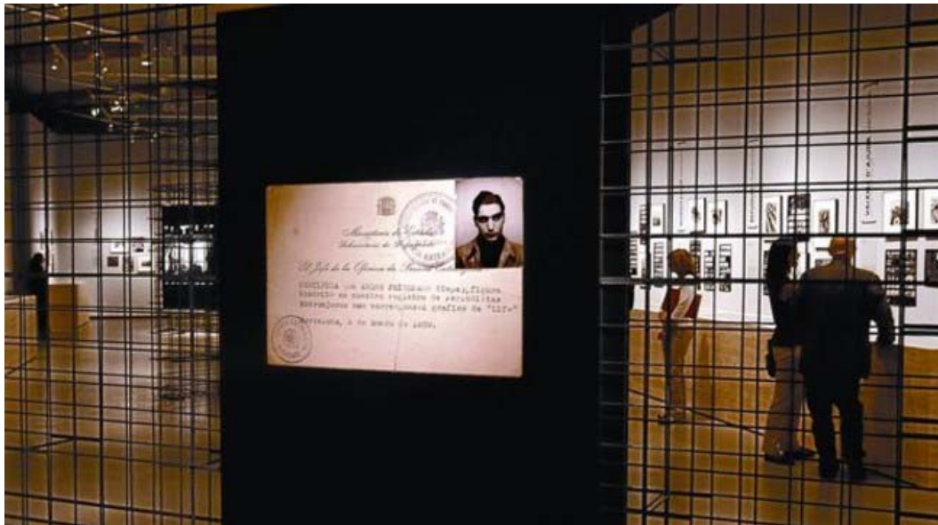
La acreditación como fotoperiodista de Robert Capa, en una de las salas de la exposición que abre hoy las puertas en el MNAC.