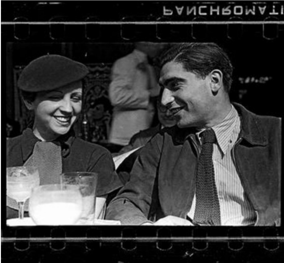
Gerda Taro y Robert Capa, en la terraza del Café du Dôme de París, retratados por su amigo Fred Stein (principios de 1936). FRED STEIN SCrt ESTATE OF FRED STEIN INTERNATIONAL CENTER OF PHOTOGRAPHY