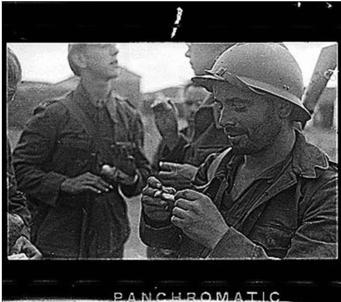
1937. soldados republicanos en La Granjuela (Córdoba), por Gerda Taro. GERDA TARO SCrt INTERNATIONAL CENTER OF PHOTOGRAPHY

desaparecidos y en enero del 2008 el escritor Juan Villoro, hijo de un exiliado republicano, anunciaba en este diario su redescubrimiento.