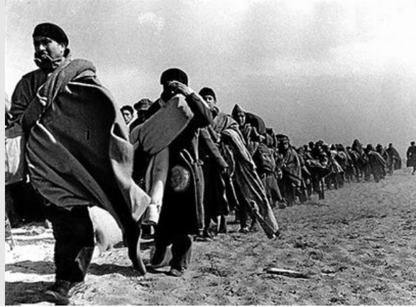
Marzo de 1939. Columna de soldados republicanos en la playa, en el campo francés de concentración de Barcarès, por Robert Capa. ROBERT CAPA SCrT INTERNATIONAL CENTER OF PHOTOGRAPHY / MAGNUM

Esto puede ser solo un prólogo de lo que suceda cuando los hijos de aquellas decenas de miles de soldados acurrucados en las arenas de las playas francesas (solo de Argelers, de Barcarès, de Bram y de Montolieu hay más de 300 negativos), por ejemplo, puedan rastrear forzando la vista hasta 100 reproducciones de reportajes completos, del primero al último disparo de la cámara.