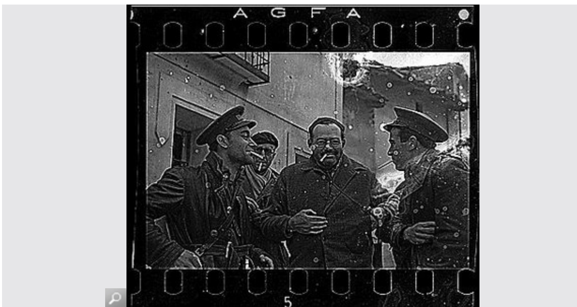
Hemigway y, detrás de él, Herbert Matthews, en Teruel, diciembre de 1937.

El círculo de miles de fotografías de la guerra civil española se cierra hoy, 75 años después, en el Museu Nacional d'Art de Catalunya. Los niños que aparecen en las fotografías jugando o sufriendo, los hijos de los soldados vencidos, hacinados en los campos de concentración franceses, los nietos de los refugiados en el Estadi de Montjuïc tras huir de los combates en Andalucía, podrán recordar aquel pasado en la exposición La maleta mexicana. El redescubrimiento de los negativos de la guerra civil española de Capa, Chim y Taro , que con más de 3.000 imágenes abre sus puertas al público hoy, y hasta el 15 de enero.