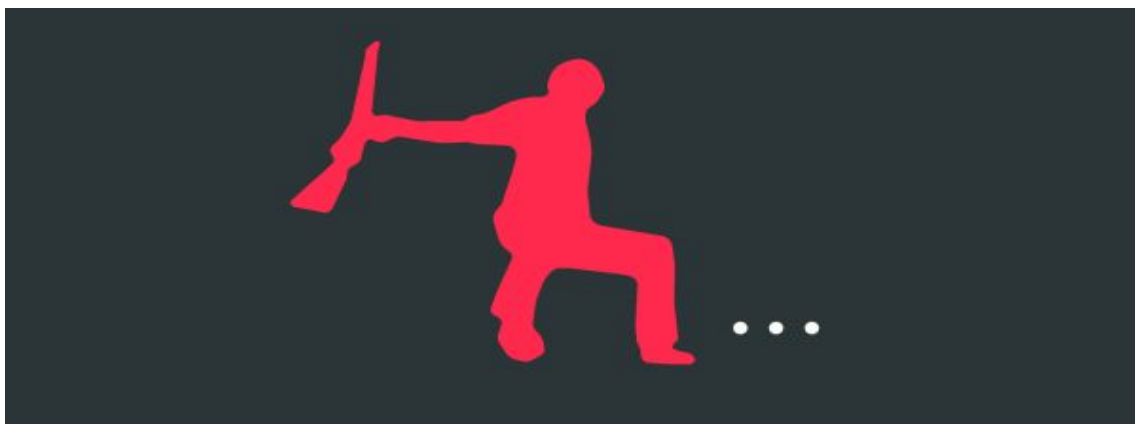
Ilustración de Miguel Ordóñez

Público/ Opinión / 11.Nov.2011 / Josep Fontana. Historiador