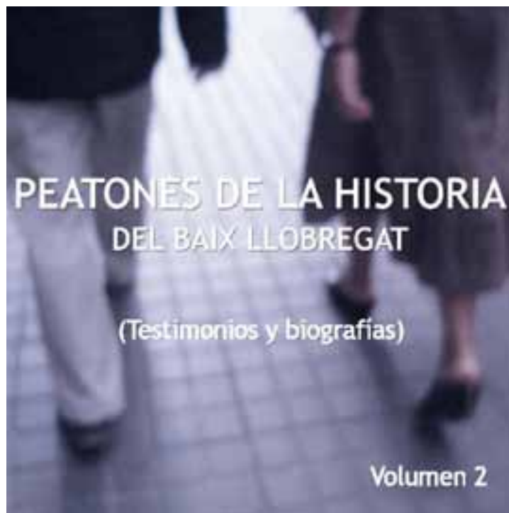
Portada del libro Peatones de la Historia del Baix Llobregat (Testimonios y biografías) Volumen II