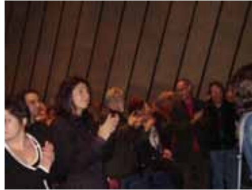
El público puesto de pie aplaudiendo el himno nacional de Catalunya.