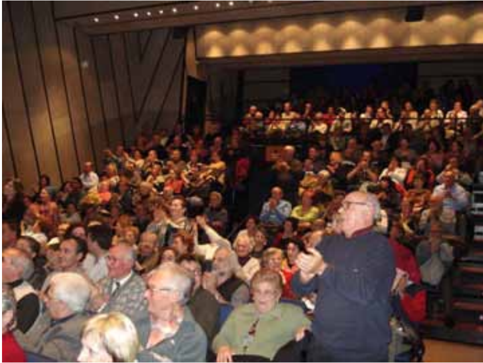
Vista general del teatro del Patronat Cultural i Recreatiu de Cornellá de Llobregat