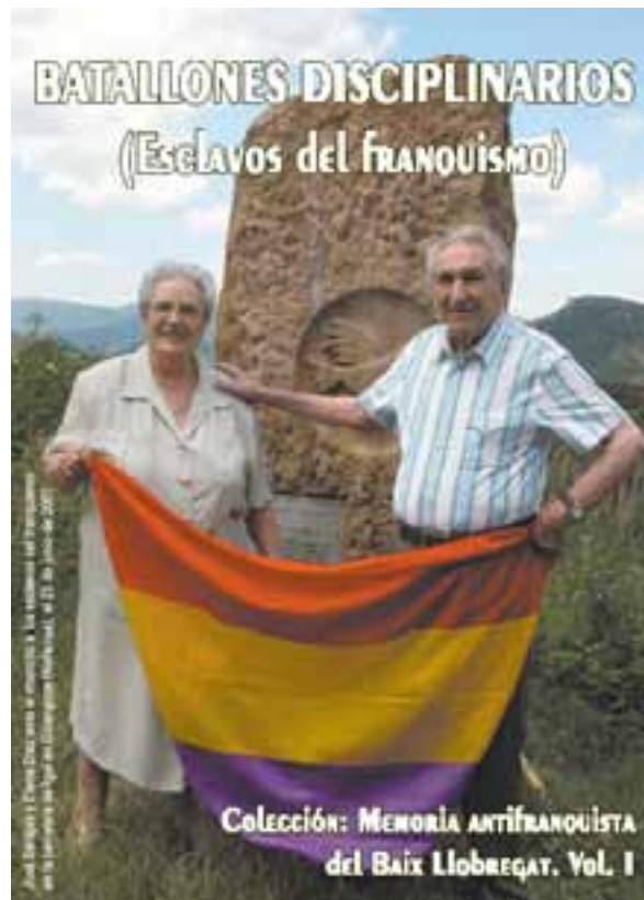
Portada del libro Batallones Disciplinarios (Esclavos del franquismo)