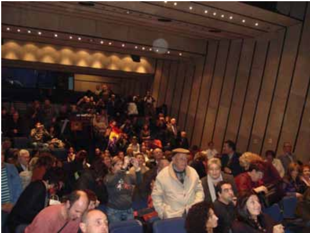
Vista general de la sala de teatro del Patronat Cultural i Recreatiu de Cornellá de Llobregat