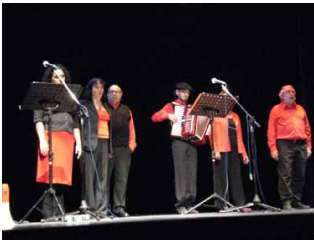
Cuadro de actores del grupo teatral Catorzedabril

Después del manifiesto, los asistentes, que habían agotado las entradas, hasta el punto que se va a haber de colocar sillas en los pasillos, van a aplaudir la representación teatral. Lo más destacable va a ser la complicidad entre el público y los actores. Un buen ejemplo va a ser el canto de la Internacional en el que va a participar buena parte del público con el puño levantado.