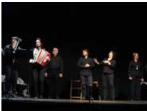
Actores grupo teatral Catozedabril