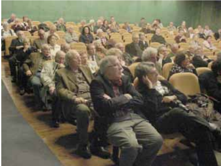
Sala de actos del Ateneu Barcelones