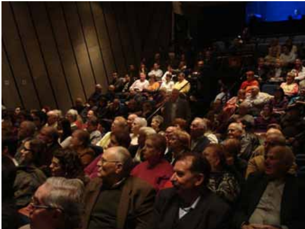
Salón de acto del Patronat desde otro angulo