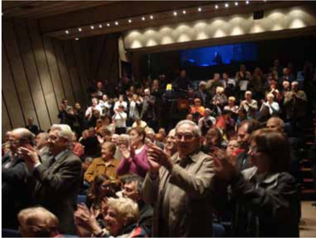
Salón de actos. El público en pie aplaudiendo