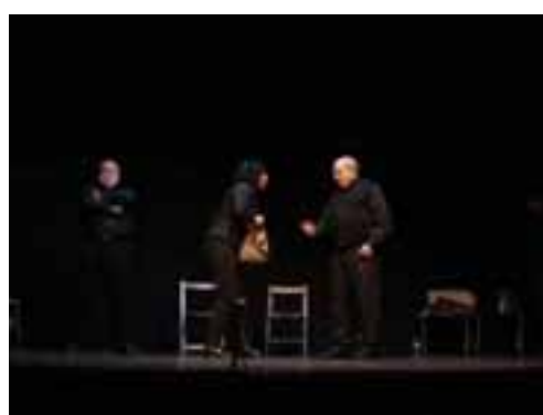
Una escena de los interrogatorios de la BPS