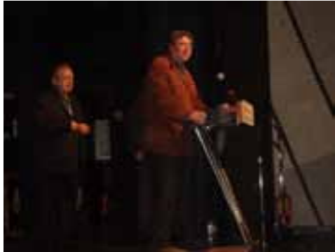
Alcalde Cornellá Antonio Balmón