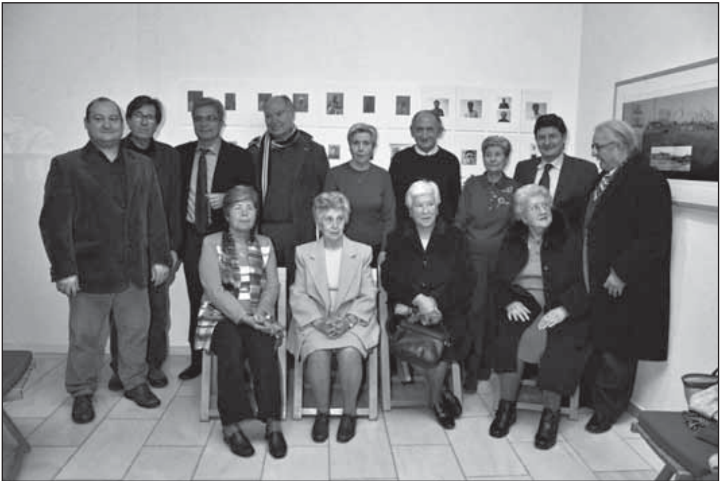
Gener 2005. Alcalde acompanyat de fills dels represaliats pel franquisme. En el marc de l'exposició s'homenatgeja als afudellats durant el franquisme i per extensió als represaliats.

tat i fer front així a una societat cada dia mes globalitzada. Ara, que el Prat afronta uns anys apassionants per les transformacions que comporta els projectes del