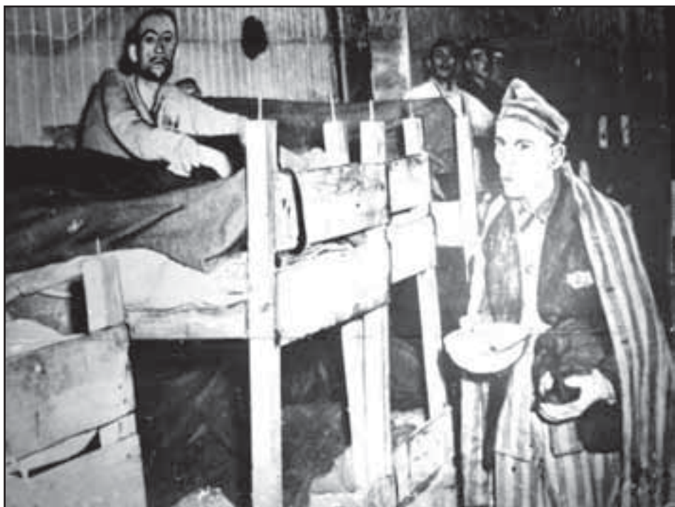
Camp de concentració de Mauthausen

Tal vegada tanta injustícia, al cap de 25 anys podria haver estat reparada. De fet, ha de ser reparada! Per això ERC posà com a condició al suport a la investi-