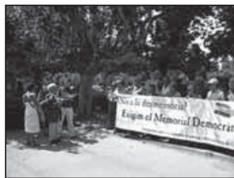
14 de juliol 2006. Associacions exigint el Memorial Democràtic, davant del Parlament Català.

Quan parlo de diversitat em refereixo, per exemple, a l'ampli ventall d'interessos que representen les cinc exposicions presentades, en itinerància o programades en el període desembre 2005-desembre 2006: "La Maternitat d'Elna, bressol de l'exili. 1939-1944", una lluminosa història d'amor i solidaritat, en col·laboració amb l'ajuntament rossellonès d'Elna; "República! Cartells i cartellistes. 1931-1939", coproduïda amb el Museu d'Història de Catalunya i el Centre d'Estudis Històrics Internacionals-Pavelló de la República, en commemoració de la proclamació de la República; "Els Jocs oblidats.