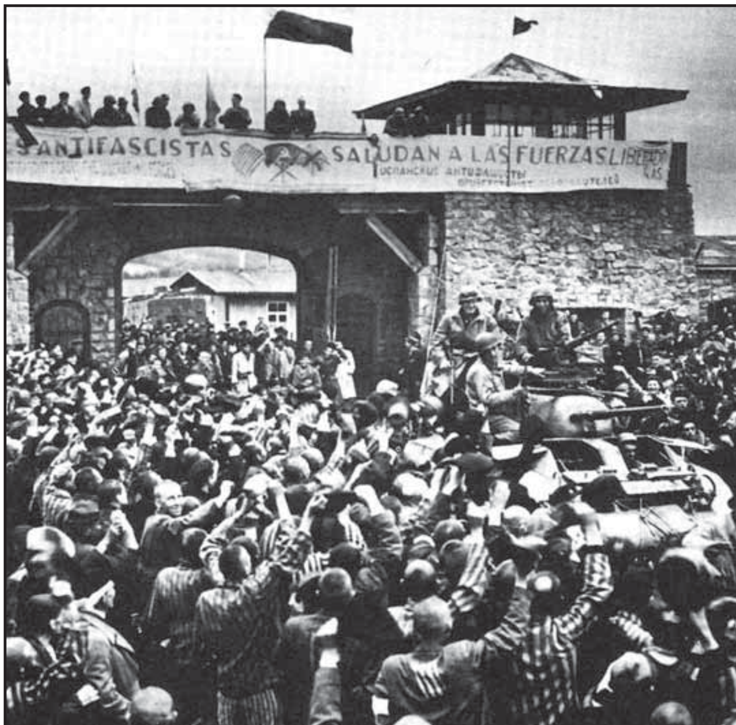
1945. Liberación por las tropas aliadas, de los prisioneros del campo de concentración de Mauthausen