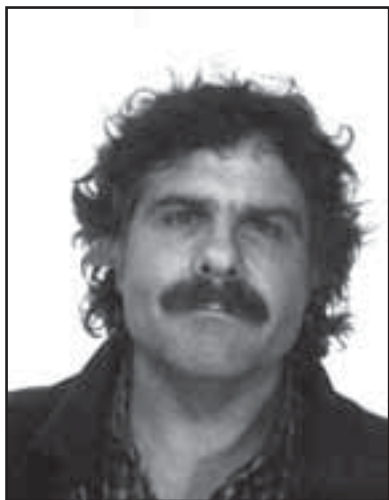
Joan Tardà i Coma