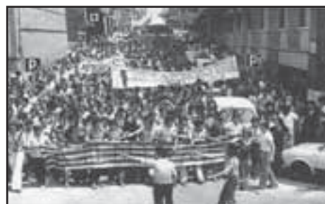
1976. Manifestación en Cornellá por la amnistía

En Comisiones Obreras siempre hemos entendido que la defensa de los derechos de los trabajadores y trabajadoras se extiende más allá del puesto de trabajo. De ahí