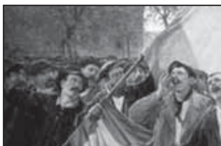
1931. Proclamació de la II República

És necessari, digne i de justícia, tornar a escriure la història de la Segona República Espanyola i la posterior Guerra civil i repressió franquistes, per poder retornar la dignitat i el bon nom a tantes i tantes persones que van ser injustament perseguides, mortes i empresonades pel règim vencedor. No podem oblidar les prop de dues-centes persones afusellades tant sols a la nostra comarca, ni els que acabaren les seves vides en els camps d'extermini nazi, o els que passaren els anys posteriors a l'acabament de la Guerra a les presons franquistes, als camps de treball forçat o els que es troben encara indignament enterrats a les fosses de la vergonya. Tot aquest treball de recuperació de la veritat històrica que tot just comencem ara a fer, serviria de ben poca cosa si no l'acompanyem del veritable homenatge que avui podem fer a aquelles persones: la recuperació dels seus valors i fonaments ideològics, per tal d'incorporar-los a la nostra vida pública i col·lectiva. Ells i elles reviuran de nou entre nosaltres, en la mesura que aconseguim dignificar el seu llegat ideològic i recuperar per a tothom els seus valors i conviccions basats en els seus ideals de democràcia i justícia social.