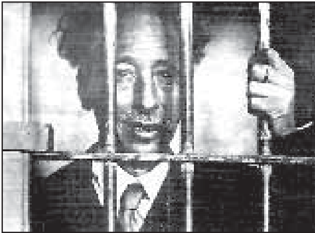
1934. El President de la Generalitat Lluís Companys a la presó

dura de Rodríguez Zapatero, com a president, l'elaboració d'una llei de la Memòria que fes allò que no es va dur a terme fa 25 anys. I el PSOE, que ja n'hi ho havia contemplat en el programa electoral, ho acceptà.