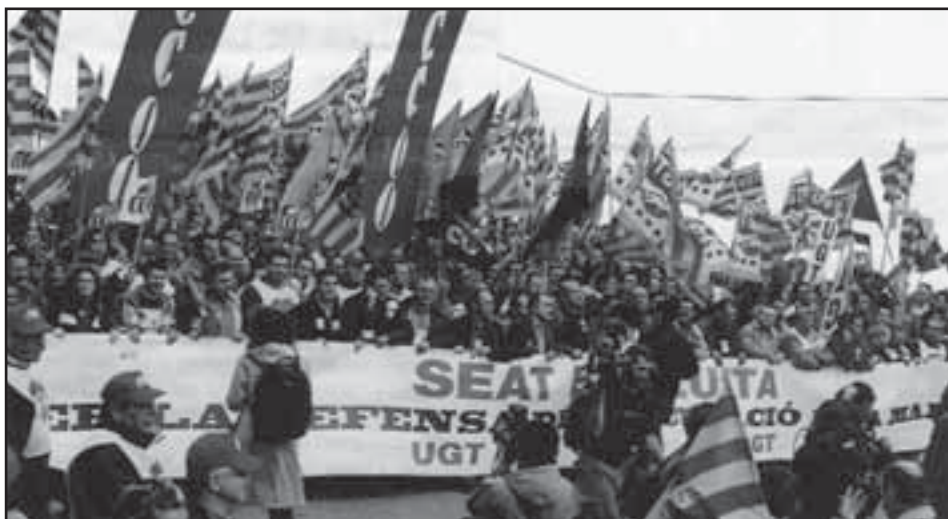
2006. Manifestación contra los despidos en la empresa SEAT

Tenemos la firme voluntad de seguir en primera línea, aportando nuestra contribución al discurso histórico para que cuando éste sea relatado; el papel de CCOO siga siendo hilo conductor de la lucha por la mejora de la calidad de vida y trabajo en el Baix Llobregat.