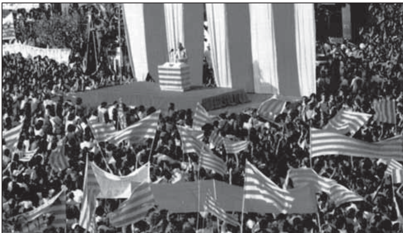
11 setembre 1976. Plaça Catalunya de Sant Boi de Llobregat, assisteixen unes 100.000 persones.

La revista número 0 del novembre de 2005, la revista portaveu de l’Associació per a la Memòria Històrica i Democràtica del Baix Llobregat, ha encapçalat la portada amb un títol que parla per si sol, “Memòria antifranquista del Baix Llobregat” i una foto de la gran manifestació-concentració a la plaça de Catalunya de Sant Boi l’any 1976. La gran diada de l’Onze de Setembre on el poble català