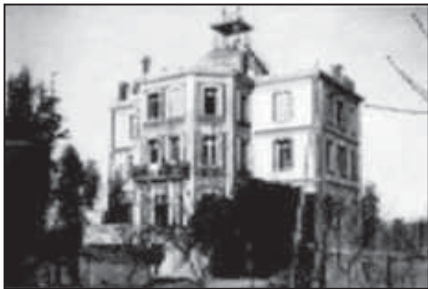
Maternitat d'Elna (aquí van néixer 597 nens durant 1939 i 1944)

L'Olimpiada Popular del 36", en compliment d'una resolució que instava el govern de la Generalitat a commemorar aquesta resposta a les Olimpíades de Hitler avortada per la rebel·lió franquista; "Al front i a la rereguarda. Testimonis i vivències de la Guerra Civil", coproduïda amb l'Arxiu Nacional de Catalunya, que ofereix una visió més íntima i personal d'un fet col·lectiu tan transcendent; i "Els mapes de la Guerra Civil espanyola. 1936-1939", produïda conjuntament amb l'Institut Cartogràfic de Catalunya, que aborda un aspecte gens conegut de la contesa militar.