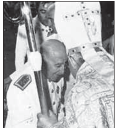
El Papa Pio XII beneïnt a Franco