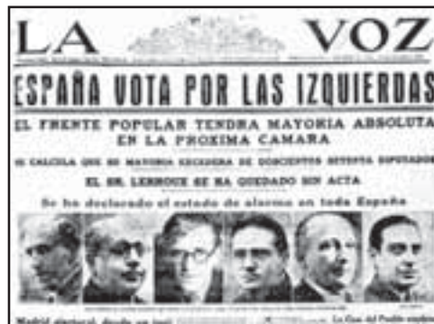
1936 Elecciones Febrero. Vota por las izquierdas.

Y otra forma de gran alcance fue igualmente la Ley de Cooperativas, promulgada también en el mismo periodo.