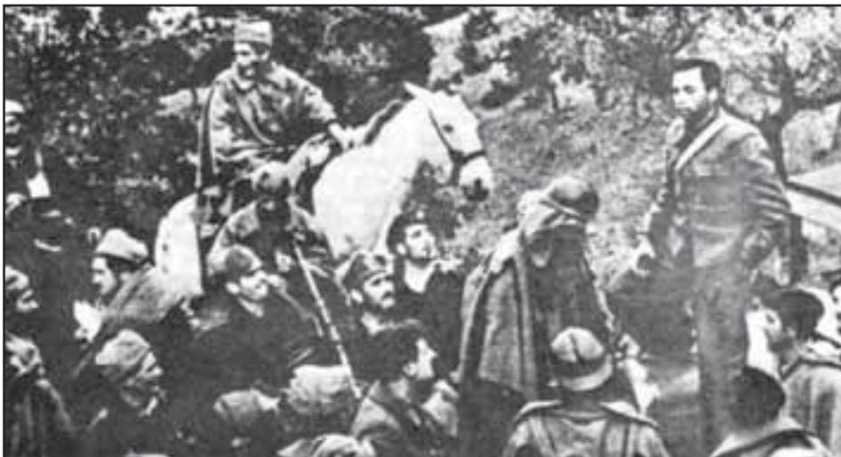
Miguel Hernández, dirigiendo la palabra a unos soldados Republicanos

Miguel Hernández, como otros poetas de la época, hoy, al recordar los setenta y cinco años de la segunda República española, vuelve a tener una vigencia total. Sus valores, su compromiso, su fuerza y su confianza en el pueblo son necesarios e imperecederos desde un compromiso social de izquierdas.