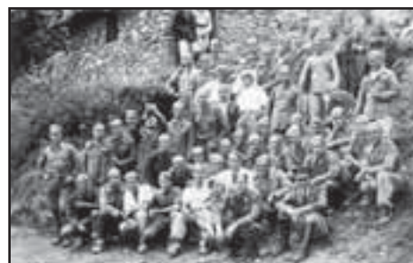
Camp de concentració: Els esclaus del franquisme

Aquesta manera d'actuar no és casual. Respon als criteris consagrats per la legislació internacio-