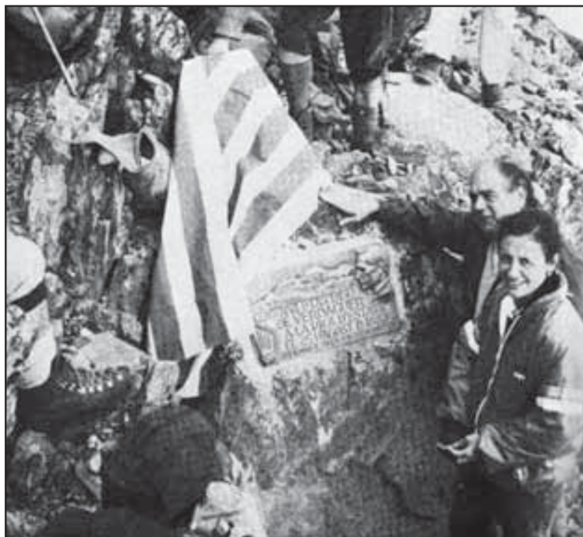
El 25 d'agost de 1983, un segle després de Verdaguer, el president i la seva esposa superen la Pica d'Estats.

Però, encara ara... ha de transcórrer un llarg temps de lluita per a que aquesta generació -i les següents- puguin arribar a exercir plenament com a catalans.