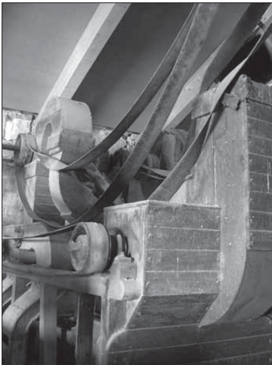
Treballs de restauració i recuperació de l'antic molí de Ca l'Arana, un dels que se conserva d'aquestes característiques. L'arròs fa ser conreu destacat al Prat de Llobregat en diferents moments del S. XX.

La Història no és una mirada nostàlgica del passat ni tampoc la revenja dels vençuts. La memòria, personal i col·lectiva, nacional i de classe, és un dret inviolable a la pròpia identitat. El dret a saber d'on venim per a decidir on volem anar. L'obligació que tenim, amb els ulls al present, a rebutjar la ignomínia i qualsevol idea i actitud que vulneri el respecte dels drets humans, començant pel més elemental que és la vida, i la sobirania dels ciutadans i les ciutadanes en el govern de la cosa pública. La Història i la memòria pública han de servir, si més no, d'esperó en la construcció d'una societat més lliure i amb més oportunitats per tothom. En aquest sentit, la Història no és neutral ni la memòria pública pot ser ambigüa.