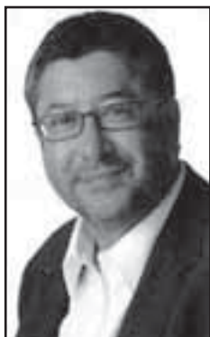
Antonio Balmón Arévalo Alcalde de Cornellá de Llobregat

Entre els dies 23 i 26 de gener de l'any 1939, les tropes franquistes ocuparen la totalitat dels pobles i viles de la comarca del Baix Llobregat, en el marc de les operacions militars prèvies a la caiguda de Barcelona. Acabava, així, de forma traumàtica i violenta, el règim de llibertats i democràcia més llarg de la història d'Espanya.