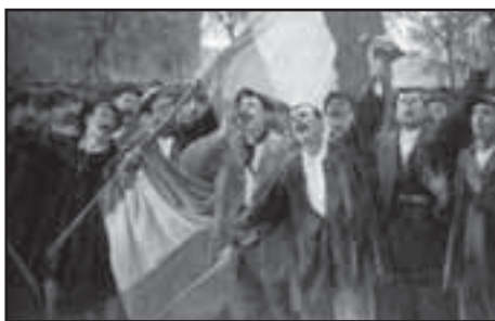
1931. Proclamació de la II República

sitat de la creació de la institució i ens fan sentir optimistes de cara al futur més immediat. Des del Programa per al Memorial Democràtic creiem que, en bona part, això és fruit de la bona sintonia entre el Programa i les entitats, i resultat del treball dut a terme, cadascú dins el seu àmbit, durant aquests dos anys i escaig.