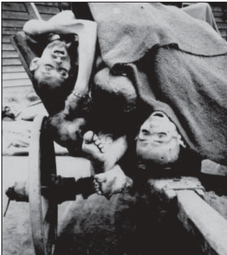
Mauthausen: transportando cadáveres al crematorio

Nuestra asociación no entrará a debatir las cuestiones terminológicas, y/o las acepciones técnicas respecto la diferenciación entre ilegitimidad o ilegalidad del régimen fascista, siempre interesantes e interesadas, pero seguiremos, por convencimiento y responsabilidad, reivindicando el pleno reconocimiento y restitución moral de quienes sufrieron condenas a muerte en juicios sumarísimos bajo una normativa emanada del golpe militar que acabó con el estado democrático y de derecho instaurado con la Segunda República. Apelamos, por último, a los poderes del Estado -ejecutivo, legislativo y judicial- para que en el ejercicio de su responsabilidad ética, moral y democrática se comprometan a desarrollar la ley complementándola, en consonancia a los acuerdos y la legislación internacional, en todos aquellos aspectos que en el actual redactado resulten insuficientes o injustos y que aparecen como manifiestamente mejorables.