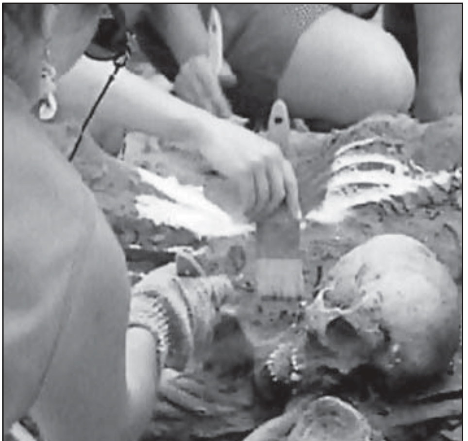
Descubriendo una fosa común