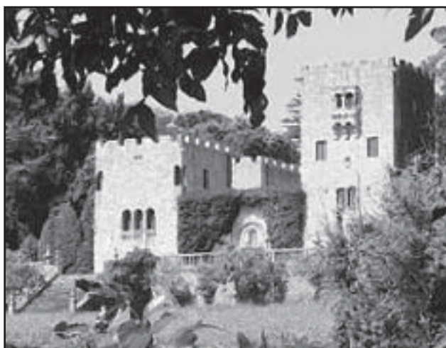
El pazo de Meirás, la residencia veraniega de los descendientes de franco