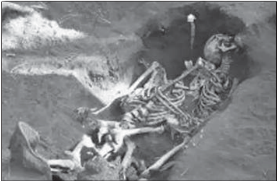
Cadáver en una fosa común

colectivos que han solicitado respuestas a sus legítimas peticiones de justicia, pero aún y así, es una Ley que nos da los instrumentos necesarios para continuar trabajando, para exigir el cumplimiento de las actuaciones dirigidas a reparar una parte de nuestra historia que continúa siendo la "deuda pendiente" de nuestro país.