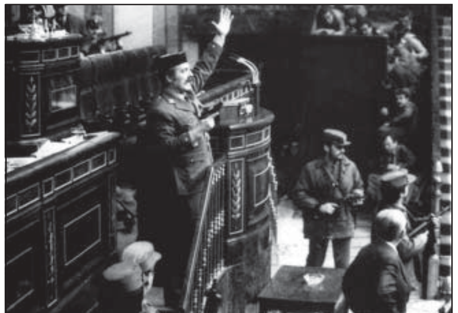
23 de febrero 1981. Asalto al Congreso de los diputados por Antonio Tejero