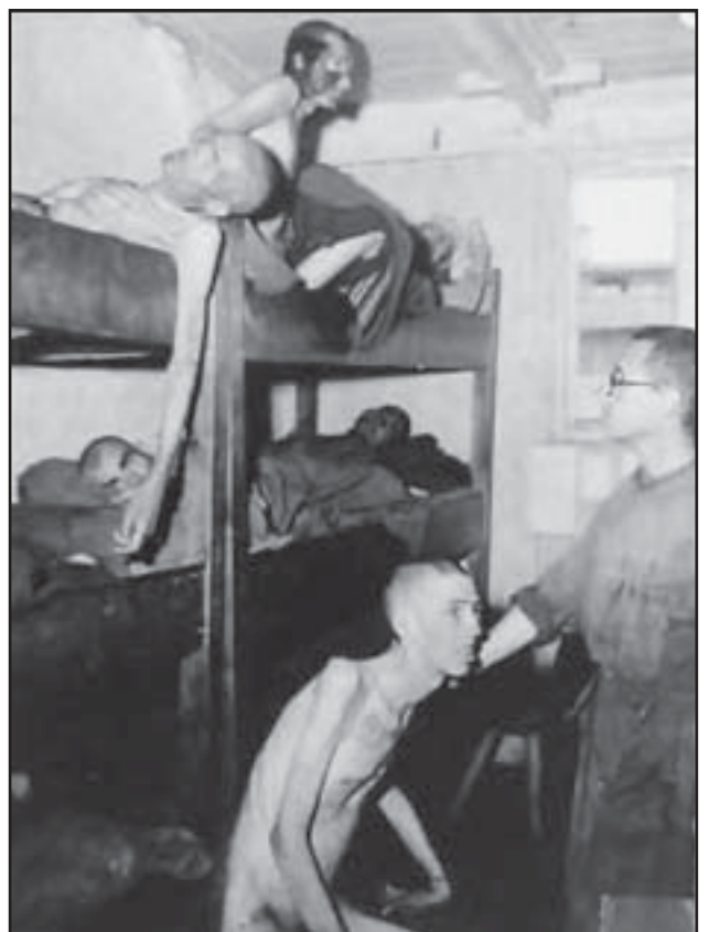
Mauthausen: Barracones campo concentración