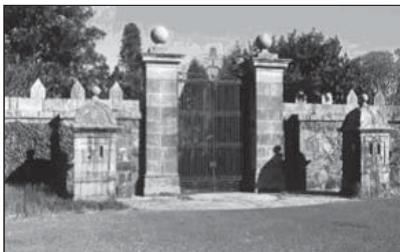
Entrada a los jardines del pazo de Meirás