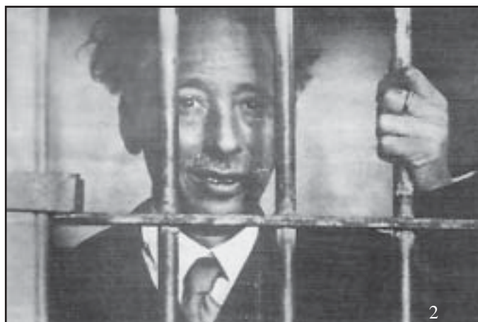
1. Lluís Companys i Jover (1882-1940) 2. Lluís Companys encarcelado por los sucesos de octubre de 1934.