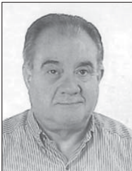
EXPOSICIÓN DE MOTIVOS.

Conclusiones después de estudiar el proyecto de ley, aprobado primero en el congreso de los diputados y después por el senado, en el que se reconocen (supuestamente) y amplían derechos y se establecen medidas a favor de los que sufrieron persecución o violencia durante la guerra civil y la dictadura.