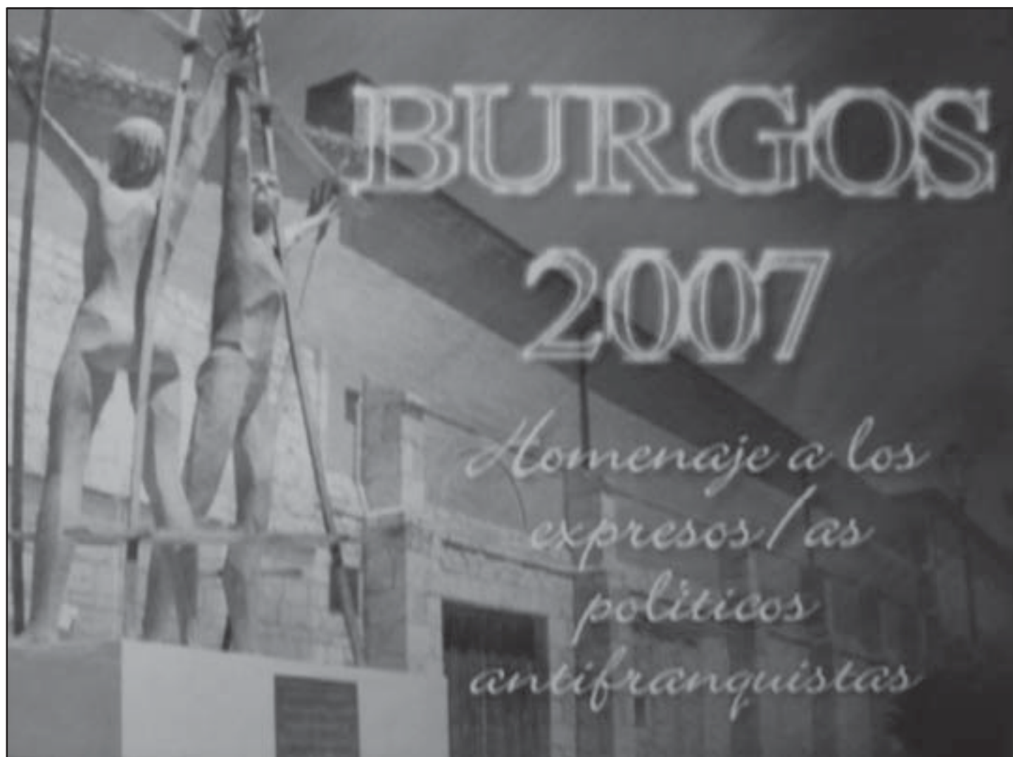
Penal de Burgos. Monument als presos polítics

Som conscients que hi ha companys que no estan d'acord amb el redactat de la llei, i respectem molt la seva opinió, però considerem que si ho miren positivament veuran que no som al final de res i que cal continuar treballant plegats amb el convenciment que la llei obre un camí per aconseguir els nostres objectius de recuperació de la memòria històrica. I vull acabar dient-vos, amigues i amics, que en aquest camí continuareu trobant en l'Associació Catalana d'Expresos Polítics, com sempre, un company de viatge decidit a marxar fins al final.