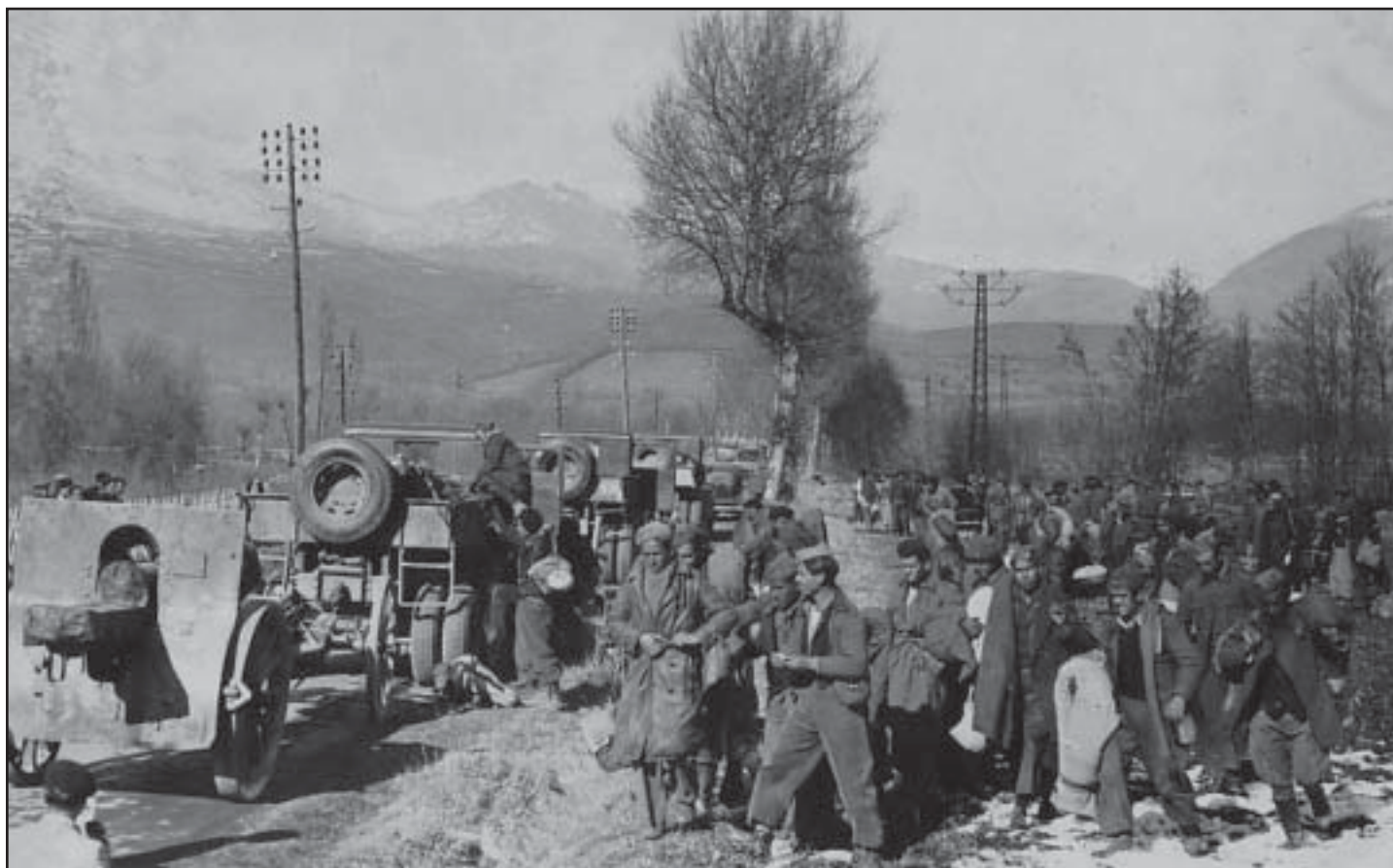
1939. Puigcerdà. Artillería Republicana abandonando las armas.

didad por el sufrimiento de lo que supone la desgracia de una guerra civil. Y entonces, no ahora, podremos avistar el futuro con la mirada limpia.