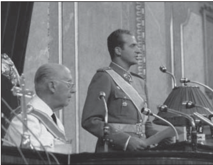
Franco nombrando, como heredero, rey de España a Juan Carlos de Borbón

El camino no será fácil. ¿Lo ha sido hasta ahora?