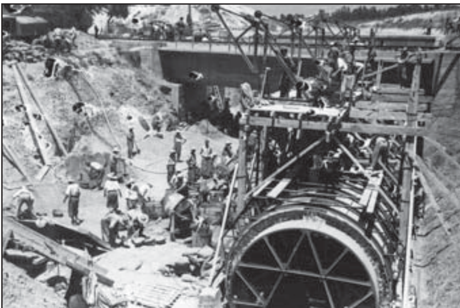
Decada de los cuarenta- Presos Republicanos construyendo el canal del Guadalquivir

Los otros grandes temas de esta Ley, y de los que se ha estado más pendiente política y mediáticamente, seguro que lo tratan, y analizan, con mucha más amplitud el resto de participantes en esta publicación (simbología, consejos de guerra, Cuelgamuros, fosas comunes, etc.).