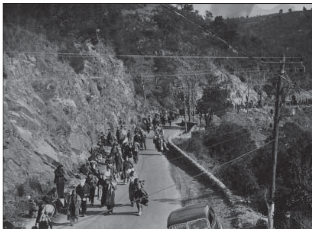
1939. Camino del exilio. Paso por el Perthus