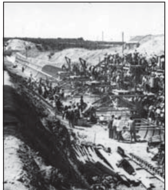
Canal de los presos