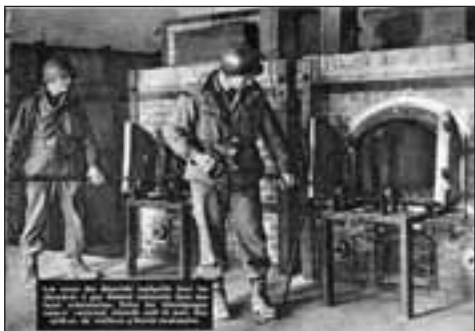
Campo de exterminio: el crematorio

Los Republicanos españoles que llegaron a Mauthausen fueron deportados a lo largo de 70 transportes entre los cuales 66 provenían de los Stalags, otros 4 del territorio francés.