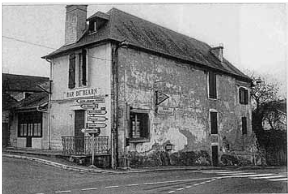
1939-1940-Lescar-Restaurante Capdevielle (mi habitación en el 2º piso)

Habíamos huido de una guerra y estábamos metidos en otra. Por fin pudimos encontrar a mi padre en Burdeos y, hasta el final de la guerra, estuvimos prisioneros de los alemanes en la Org. Todt, en el Muro del Atlántico. Mi padre siempre nos