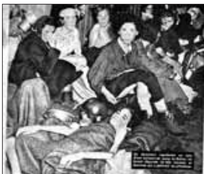
Campo de exterminio de mujeres