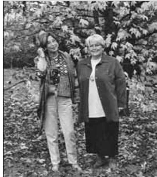
5-12-01-Lescar- Otra vez juntas....