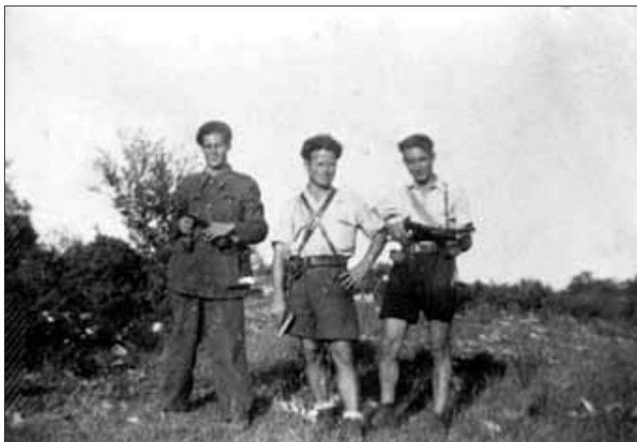
1944. 3 guerrillers

El nostre deure, a França com a Espanya, és de perpetuar la memòria de tots aquests homes i dones, de fer viure llurs ideals, de Pau i de llibertat en un món millor !