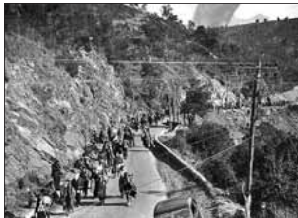
1939. Camino del exilio. Paso por el Pertthus

Al saber que mi padre había cruzado la frontera y que nos quedaríamos los tres en Francia, mi madre me dijo que me llevaría a la escuela. Debía aprender a leer y escribir y, sobre todo, podría salir de aquella habitación. Conocería los niños que jugaban en la calle y seríamos amigos! ¡Qué ilusión!! pero, al mismo tiempo, cuantos miedos!! El primer día de escuela fué un desastre. Llegamos tarde. En la clase habían unos treinta niños y niñas de todas las edades y al entrar, todos se giraron. Que mirada de rechazo! Mi madre me dio un beso y se marchó. La maestra no me hizo caso, hablaba una lengua extraña y los niños se giraban para hacerme