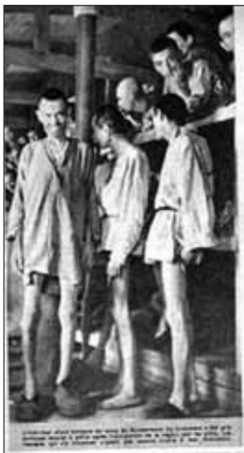
Campo de exterminio de Bückenwald