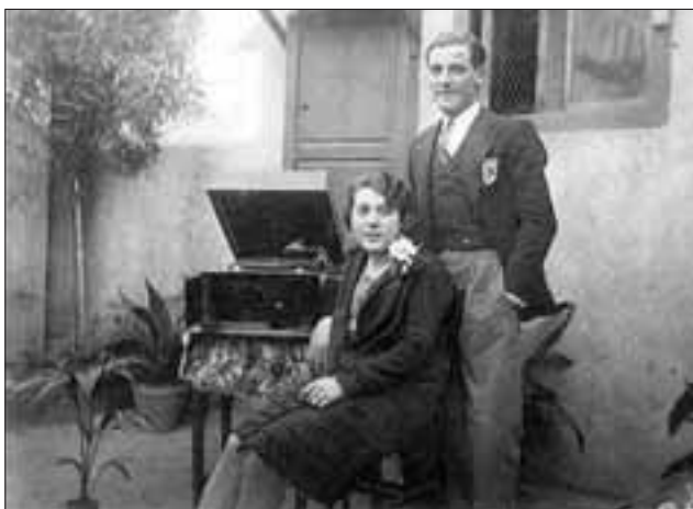
1931. Mis padres el día de su compromiso

muecas. Al salir al patio, todo se complicó. Allí se atrevieron a escupirme, a empujarme, a estirarme de los pelos.... otros, me ignoraban. No sé qué es peor porque, si te ignoran, es como si tú no existieras. Esta acogida no hizo más que reforzar mis sentimientos de culpa y me sentí perdida y humillada.