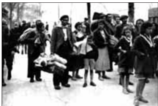
Acogida de los republicanos en el campo de concentración de Argeles