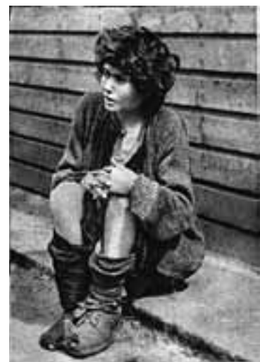
Campo de exterminio: mujer liberada en 1945

El 2 de julio de 1944, las autoridades alemanas, con la complicidad