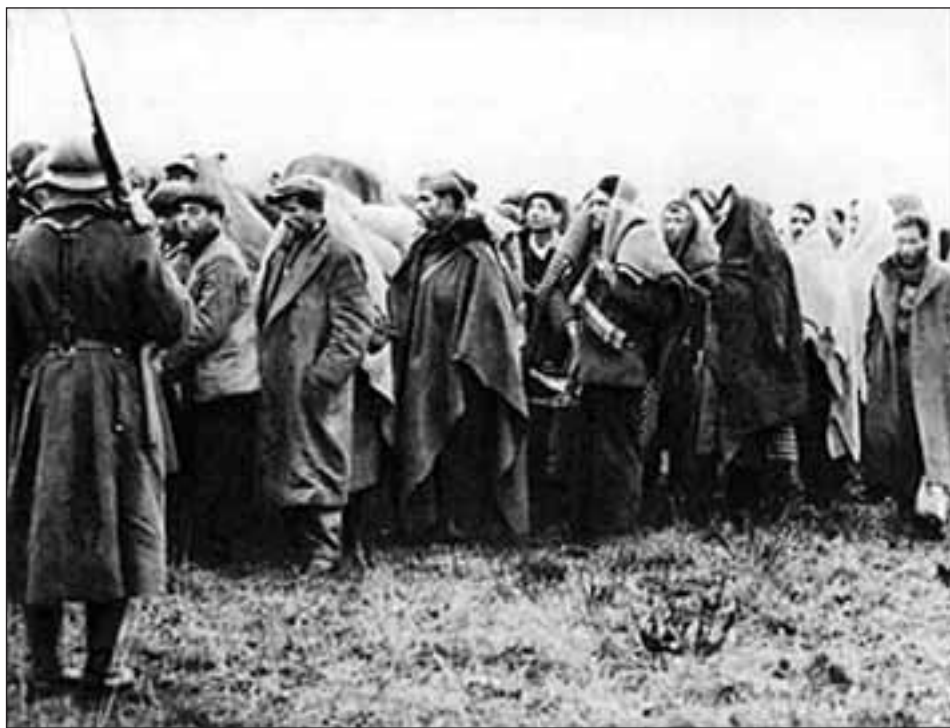
"Acogida" de los Republicanos por las fuerzas armadas francesas