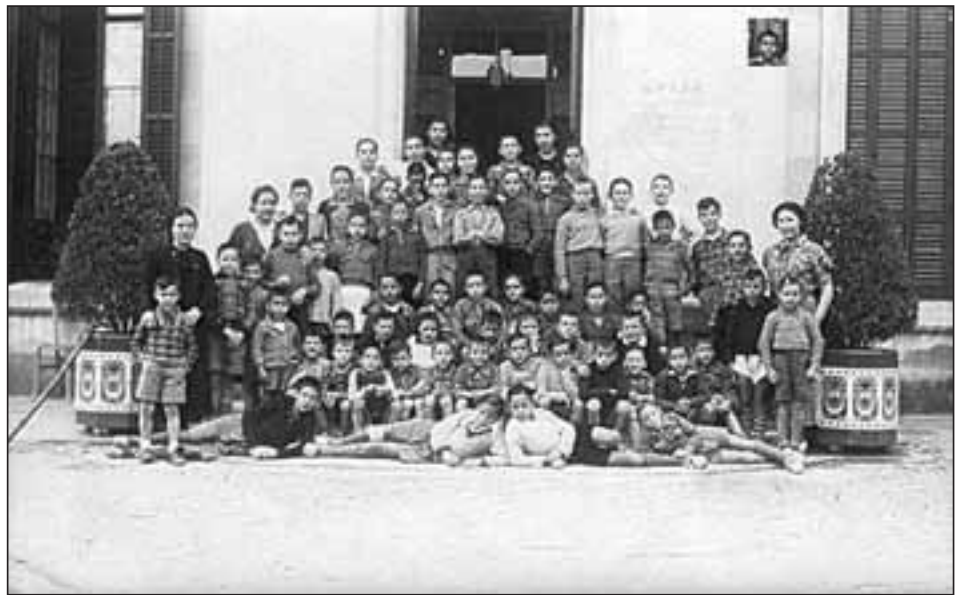
Colonia de Sidges (entre esos niños mi padre)

exterior, este término fué utilizado primariamente en la medicina y la cirugía. "Trauma" de la cual proviene nuestra palabra "traumatismo", significa en sentido figurado "daño". Para Freud el traumatismo reviste una importancia particular. Se trata de una experiencia vivida bajo el modo de un choque emotivo, de la violenta intrusión de una realidad hiriente en la vida del individuo, de tal manera que su aparato síquico no logra responder a través de los medios normales, al flujo de excitaciones que el dicho choque desencadena (Cinco lecciones de sicoanálisis). En otras palabras, la naturaleza del traumatismo impide que el sujeto elabore sus pensamientos: el estado traumático se reconoce justamente por la brusca desaparición de funciones mentales, cuando pensar deviene la causa de una angustia insopportable. El traumatismo tiene esto de paradójico, como lo subraya Simone Korff-Sausse (3) , que interrumpe la actividad síquica, forzando al mismo tiempo al espíritu a retomarla para restablecer el pensamiento allí donde lo detuvo. Es por ejemplo el esfuerzo que lleva a cabo una víctima en cada narración de su experiencia. En ese momento la actividad mental consiste en tratar de encontrar representaciones para rememorar y explicar esas vivencias insopportables que sobrepasan las categorías habituales del pensamiento: es encontrar