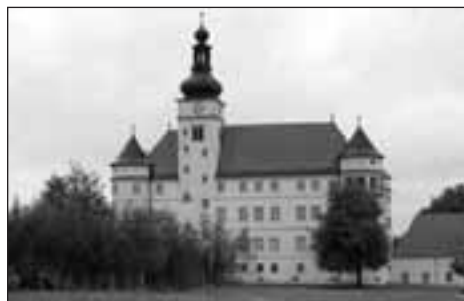
Castillo de Hartheim

La tasa de fallecimientos resulta muy alta y se acelera durante el año 1941: 119 muertos en julio, 189 en agosto, 425 en septiembre, 830 en noviembre, 687 en diciembre. 3.153 Republicanos españoles mueren entre julio de 1941 y febrero de 1942. El traslado de españoles hacia uno de