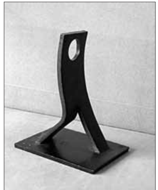
Obra de Luís Lera, escultor i fotògraf

A l'any 1938, Paredes s'exilià a la Catalunya Nord, on va treballar en pobles rossellonesos fent monuments als morts de la guerra. Posteriorment treballà en una fàbrica de nines, i més endavant impartí classes d'escultura a l'escola de belles arts d'Orleans. Morí en la indigència al 1980, al Vallespir.