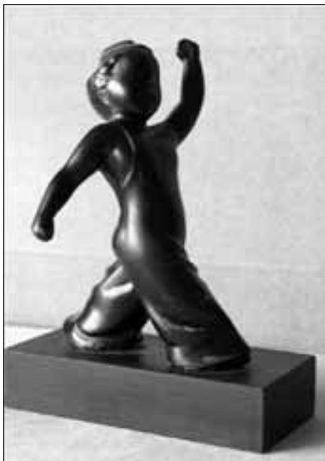
“El més petit de tots” 1939

Miquel Paredes i Fonollà (Barcelona, 1901 - Ceret, 1980) va ser un escultor català, recordat especialment per ser autor de la figureta d'El més petit de tots.