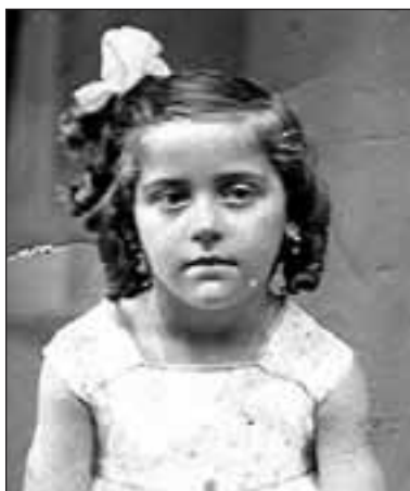
1940-Lescar- "¡¡Serás la mejor Peinada!!", pero que mirada tan triste...

Sin embargo, os he de confesar una cosa; cada primavera, cuando llegaban las primeras golondrinas, engañaba a mi madre y hacía novillos. Las golondrinas me anunciaban que, por fin, llegaba el buen tiempo y que no sería tan duro vivir en Mayet. Ya no pasaría frío, robaría las primeras frutas y los días serían más largos. No me avergüenza decir que robaba fruta. Estábamos en la miseria y tenía mucha hambre. En invierno era más duro encontrar comida. Solo podía robar remolachas. Era muy pequeña, solo tenía siete años, pero entendía que yo también tenía otra responsabilidad: ser feliz. Y por ésto, cada primavera, cuando llegaban las primeras golondrinas, me regalaba un día. Correteaba por los prados, me hacía un ramo con "coquelicots" y "boutons d'or", me abrazaba a los árboles y les contaba mis penas. Aquel día era muy feliz. Cuando vives en el campo y tienes siete años, la primavera es como un paraíso lleno de sorpresas y las vives con admiración y alegría. Por ésto, hoy también sigo regalándome cada primavera un día, y lo celebro con