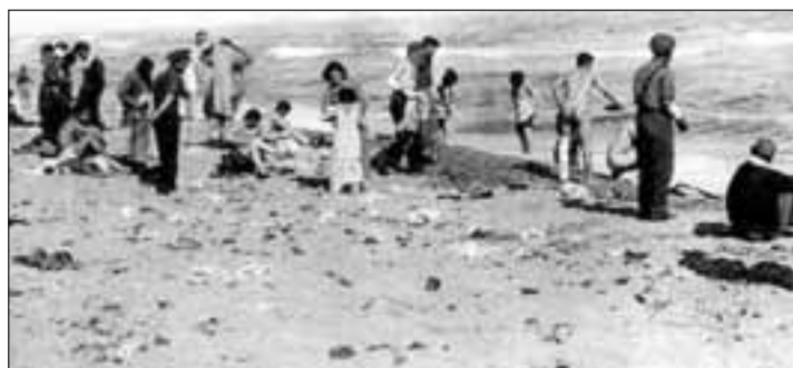
1939. Campo de Argelers que acogió a 80.000 refugiados republicanos

A partir de entonces se iniciaba una vida sobre una playa poco común, contaminada y carente de barracas donde cobijarse. Durante dos interminables meses, privados de ellas tuvieron que defenderse con sus propios medios para vencer y sobrevivir al duro y glacial invierno pirenaico, puesta la mirada en los montes que los separaban del amado país, obligados para mantener una mínima higiene a remojarse en las gélidas aguas del Mediterráneo. Era un detalle más de la etapa apo-