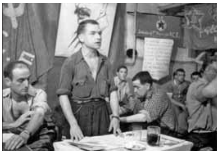
Mauthausen, 13 de mayo del 45, 8 días después de la Liberación los partidos políticos salen de la clandestinidad.