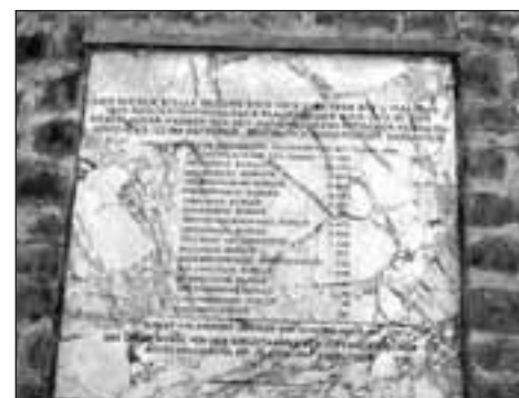
Estela de Mauthausen: 6502 muertos españoles identificados

Generalmente se considera que entre 8 a 9.000 Republicanos españoles han sido deportados hacia los campos de exterminio del Reich; hubo alrededor de un 30% de sobrevivientes. La Alemania nazi no pudo llevar a cabo el asesinato de la República española iniciado por Franco. Para aquellos sobrevivientes, considerados como apátridas e indeseables hasta el año 1945, la Amical de Mauthausen actuó, así como numerosas personalidades francesas, con gran voluntad, valor y dignidad para que se les acogiera en el país que habían contribuido a liberar. Desde entonces, la Amical deseó también que un Republicano español lleve la bandera de la asociación, también esta sigue cuidando la sepultura del famoso fotógrafo catalán: Boix. Se lo agradecemos.