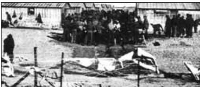
1939. Campo de refugiados de Barcarés

HOY ES ESPAÑA MAÑANA SERÁ EL MUNDO ENTERO