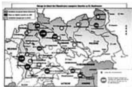
Mapa de los stalags alemanes

tre de 1941: a esos deportados se les encierra en Mauthausen. A partir de 1942, llevarán también a los Republicanos españoles hacia otros campos del Tercer Reich: las mujeres a Ravensbrück, los hombres a otros campos. Es de notar que alrededor de unos 15.000 de estos hombres serán sometidos al trabajo forzoso por cuenta de la Organización Todt, en la construcción de las fortificaciones del Muro del Atlántico. Unos 4.000 españoles más serán concentrados en las islas anglo-normandas ocupadas por Alemania. La mayor parte de los Republicanos españoles serán deportados hacia Mauthausen y pertenecen a tres grupos distintos: