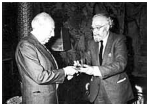
1982 : Francisco San Geroteo con Tierno Galván, alcalde de Madrid

(Autor de los libros: "les oliviers de l'exil" y "La fille de l'anarchiste" éditions Cairn Pau)