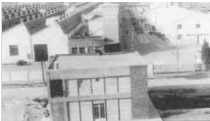
Iglesia de Sant Jaume de Cornellà donde se fundaron las CCOO del Baix Llobregat, 1965.

Un lloc de molta acció cívica i política va ser el Centre Social Almeda, però com que això és molt important, hi dedicarem un altre article.