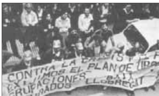
Manifestación contra la crisis y el paro en Cornellà. (Tardà J., Carrión P., 40 anys d'una ciutat)

El Baix Llobregat se ha ido transformando gracias al esfuerzo, al sufrimiento, la conciencia y la capacidad de organización de sus gentes. En definitiva, es un lugar cargado de historia, lleno de significaciones que puede y debe aportar al memorial democrático, con un carácter unitario y pluralista, todo un bagaje importante de la lucha antifranquista.