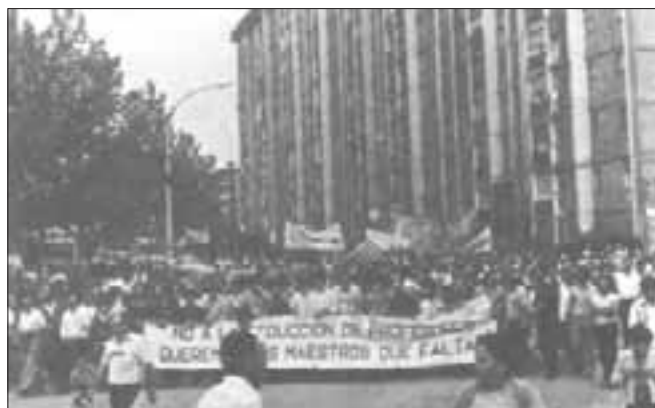
Reivindicació de mestres durant la transició. Manifestació a Sant Ildefons de Cornellà. (Tardà J., Carrion P., 40 anys d'una ciutat)

Rescatar de la memòria la infància i els records escolars positius és necessari i contribueix a valorar i construir, entre totes i tots, l'escola que volem per als nostres infants i joves, ciutadans del futur més immediat.