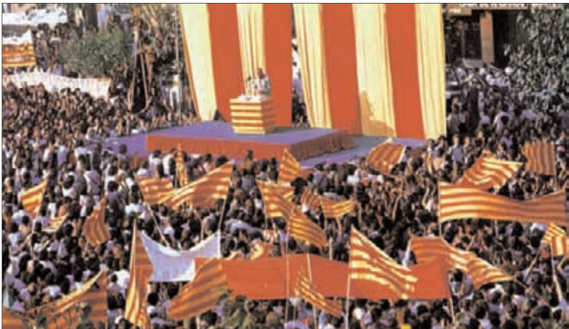
Concentració de la Diada de l'Onze de Setembre, en la qual es va reivindicar la Llibertat, l'amnistia i l'Estatut d'Autonomia. Sant Boi de Llobregat, 1976

Portaveu de l'Associació per a la Memòria Històrica i Democràtica del Baix Llobregat