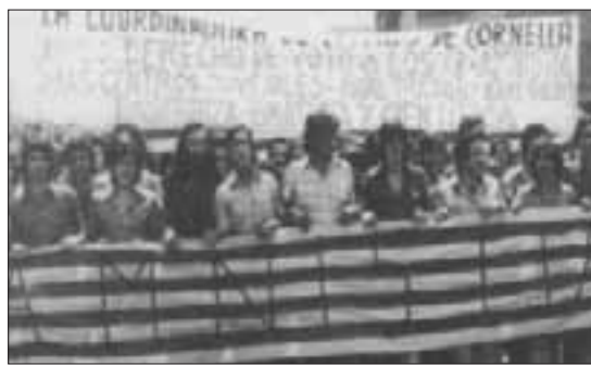
La primera manifestación legal en Cornellà. (Tardà J., Carrión P., 40 anys d'una ciutat)