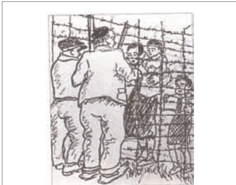
Dibujo realizado por un preso republicano en un campo de concentración (La visita de la familia)

Estos valores de libertad, de democracia y de dignidad humana deben ser la herramienta para tener una aportación notable en el memorial democrático instado por la Generalitat de Catalunya, pues somos herederos de la generación que defendió la República. Son muchos los peatones de la historia que Franco obligó a huir de sus pueblos de origen por razones de subsistencia y por la represión ejercida por los caciques y terratenientes. Somos un cuerpo vivo, no somos piezas de museo ni depósito de añoranzas y por ellos plenos de esperanza y por poco que la salud no los permita en plena actividad ciudadana. Por ello cuando nuestra generación desaparezca ¿quien aportará a la memoria histórica la rica experiencia y bagaje de las luchas antifranquistas del Baix Llobregat?