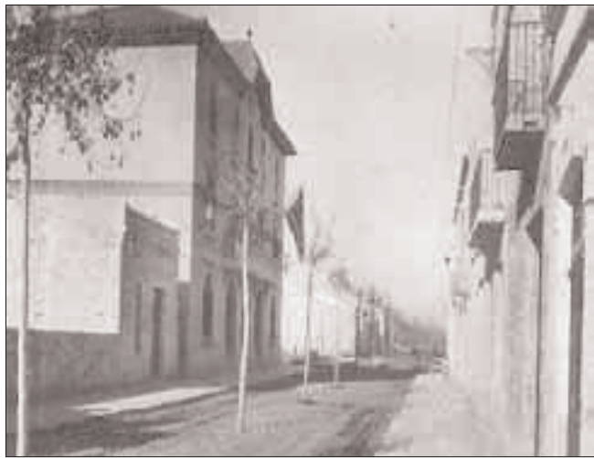
Dos imágenes de Sant Joan Despí: 1930 y 2005

lucharon por la democracia, por la libertad, por los derechos de todos los ciudadanos y todas las ciudadanas. Gracias a ello podemos contar hoy en día con ciudades y barrios equipados, con colegios y guarderías, con centros sanitarios, con centros deportivos, con bibliotecas, con zonas verdes, con calles arregladas, en definitiva, con más calidad de vida.